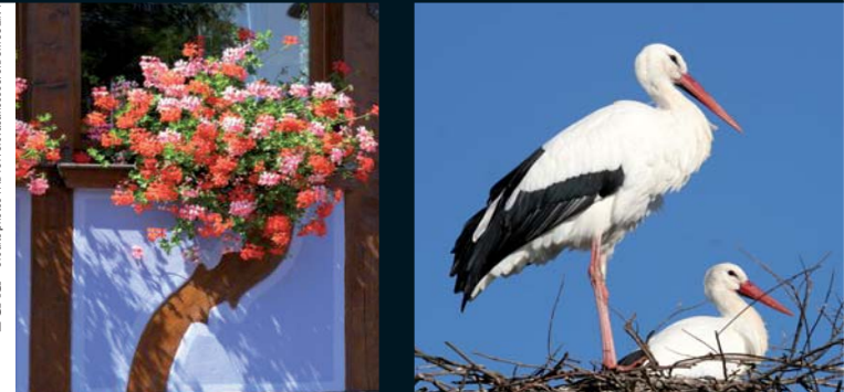
L. & I.B.