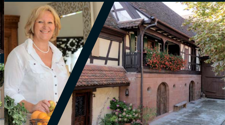
Reginau - Benthel, Lippardt, ADT 67/CF Fein, ADT 68/M. Levy - Edition novembre 2014

ADT Bas-Rhin 4 rue Bartisch 67100 STRASBOURG 03 88 15 45 88 Info@tourisme67.com www.tourisme-alsace.com