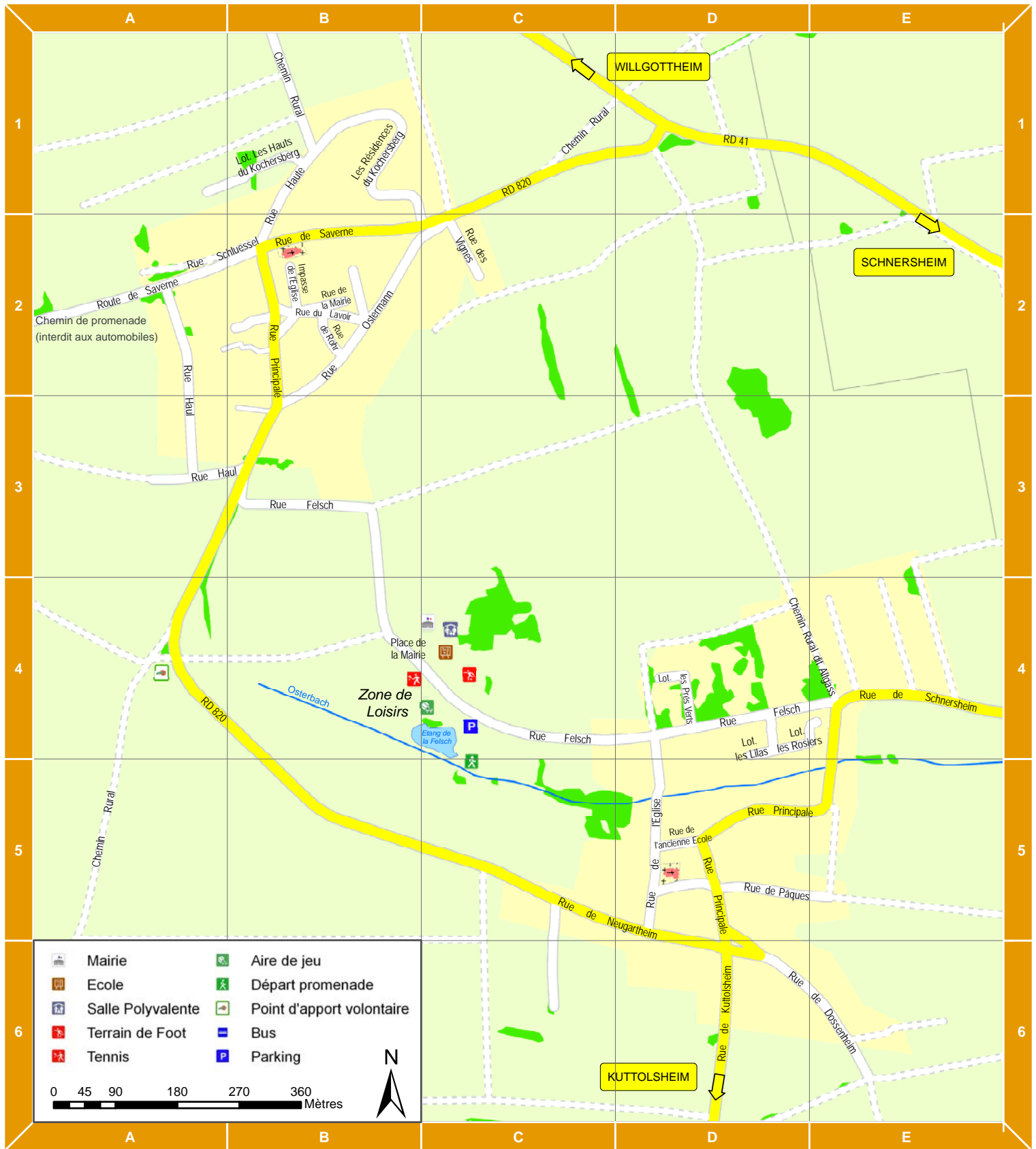
Les 28 villages de la Communauté de communes du Kochersberg